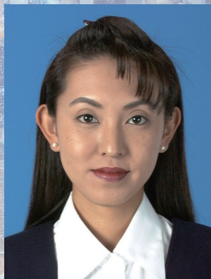
トリミング処理後